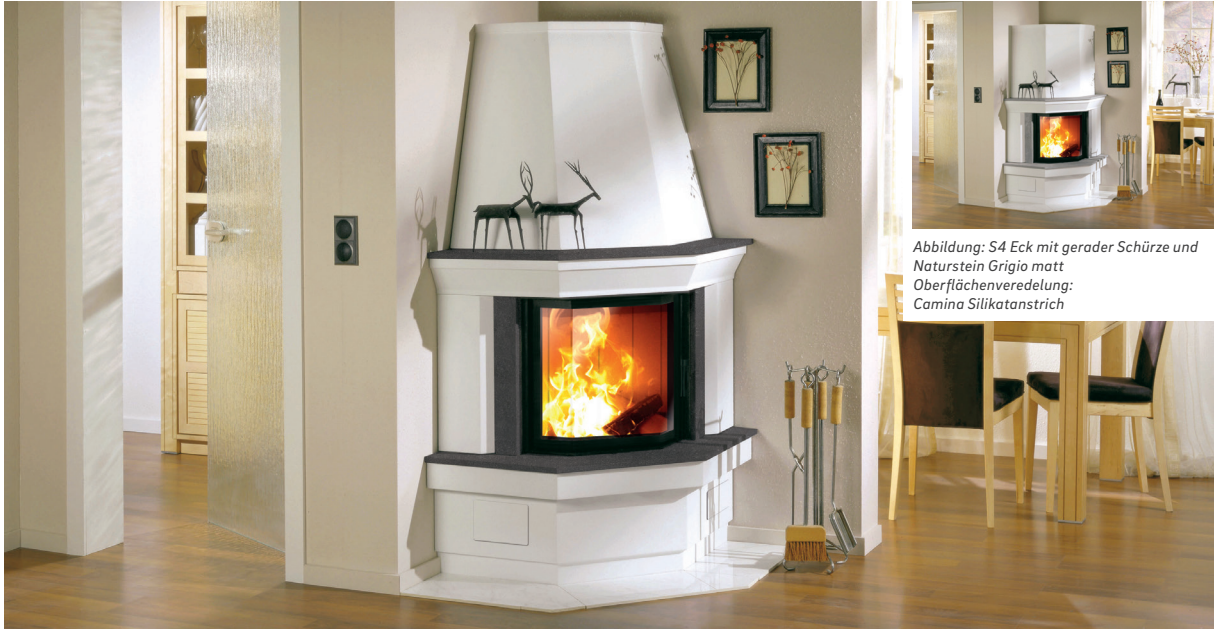
Abbildung: S4 Eck mit gerader Schürze und Naturstein Grigio matt Oberflächenveredelung: Camina Silikatanstrich