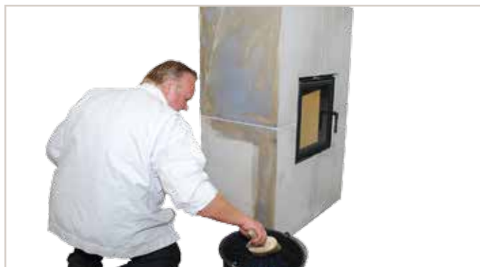
Silikat-Grund ELF 1803 1:1 mit Wasser verdünnen und gleichmäßig auftragen.

(viele Farbtöne nach Absprache in der Brillux Niederlassung möglich)