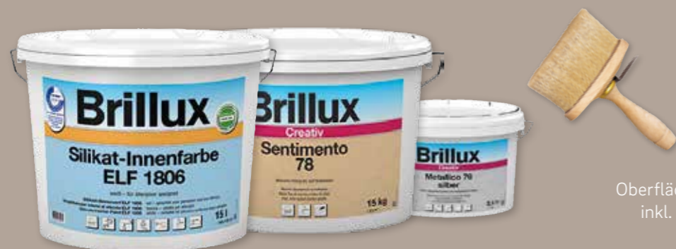
Abb. Titelseite S9 Maxi Oberflächenveredelung: Camina Silikatanstrich inkl. Schmid Kamineinsatz Ekko 45(45)80 h

Wir wünschen Ihnen viel Freude mit Ihrer neuen Speicherstein-Anlage!