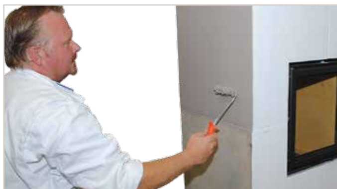
Die Anlage kann auch mit der Microfaser-Farbwalze beschichtet werden.

Tipp: Farbe immer in eine Richtung rollen (nicht herauf und herunter).