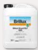
Silikat-Grund ELF 1803