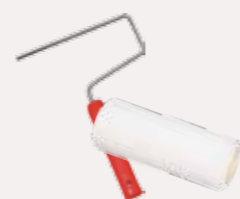
Format-Steckbügel 1101, Microfaser-Farbwalze 1221