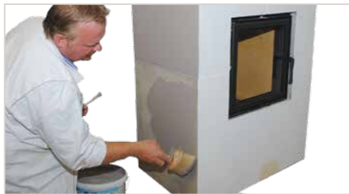
Anlage 2x mit Silikat-Innenfarbe ELF 1806 und der Streichbürste oval beschichten. Der Auftrag mit der Streichbürste wirkt wolkiger!