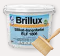
Silikat-Innenfarbe ELF 1806, Streichbürste oval 1175