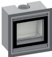
NEO-Line 5554 Blendrahmen 4-seitig 40 mm