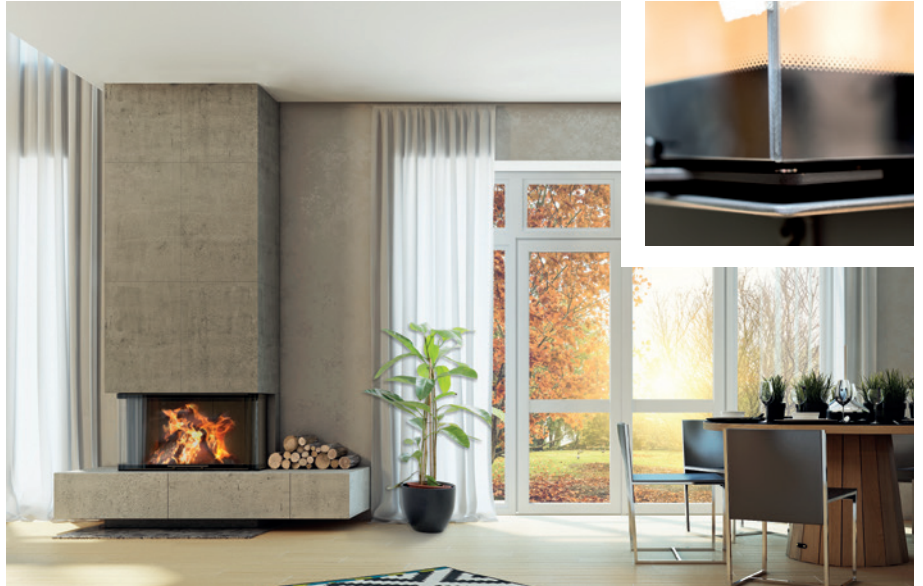
Ekko U 100(45)51 h Kristall (4-seitig bedruckt), individuelle Bauweise.

Nachdem die Luftführung 2018 überarbeitet wurde, folgt nun die Möglichkeit der Frontausführung Kristall bei allen dreiseitigen Schmid Kamineinsätzen in der Höhe 51 cm. Ergänzend zu den Überarbeitungen der gesamten Serie Ekko U hat Camina & Schmid auf vielfachen Kundenwunsch den Ekko U 45(34) als absoluten „Top Seller“ weiter verbessert. Ab Ende Quartal 1/2020 ist das Gerät mit Schamotte in „Premium-Weiß“ (vorher Caloceram) oder alternativ auch in „Anthrazit“ ausgekleidet. Im gleichen Zug wurde die Bodengruppe neu konstruiert, wodurch nun auch 25er-Holzscheite liegend eingelegt werden können.