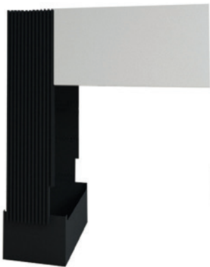
2 Komponente II Stahlverkleidung mit weißer Haube