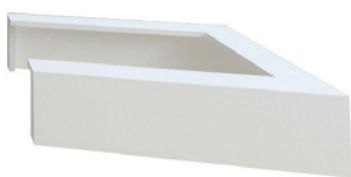
3 Komponente III Feuertisch in diversen Ausführungen

design an. Bewährte Materialien wie Stahl, Beton und Naturstein werden hier in Kombination mit einem passenden Gas-Kamineinsatz zu einer exklusiven Anlagen-Ausführung geformt. Mit dieser Form der Anlagen kann nach Belieben kreativ gearbeitet werden.