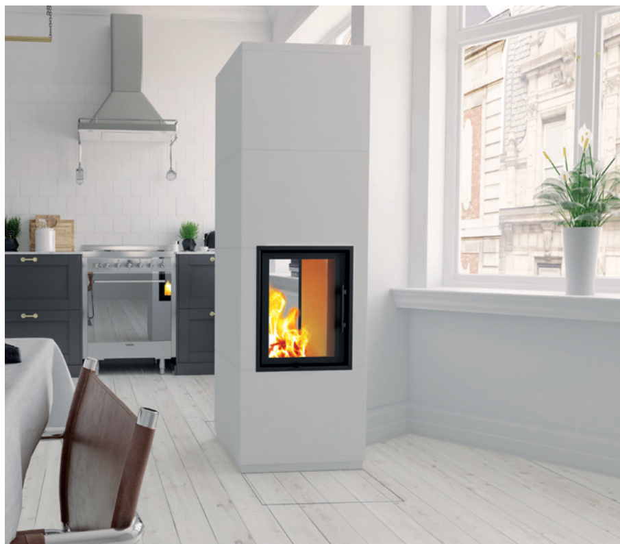
Speichersteinanlage Camina S25 inklusive Lina GO TV 4557 schwenkbar Oberflächenveredelung: Silikatanstrich