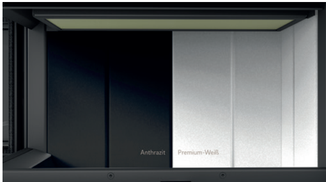
Innenauskleidung Anthrazit und „Premium-Weiß“.