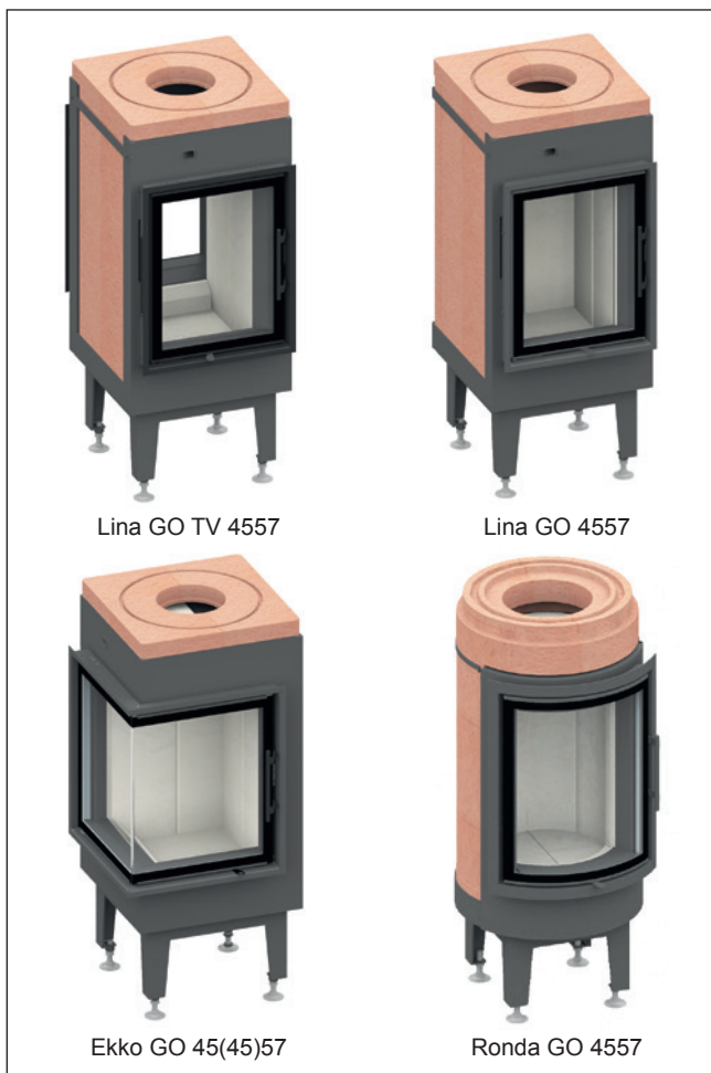
Lina GO TV 4557