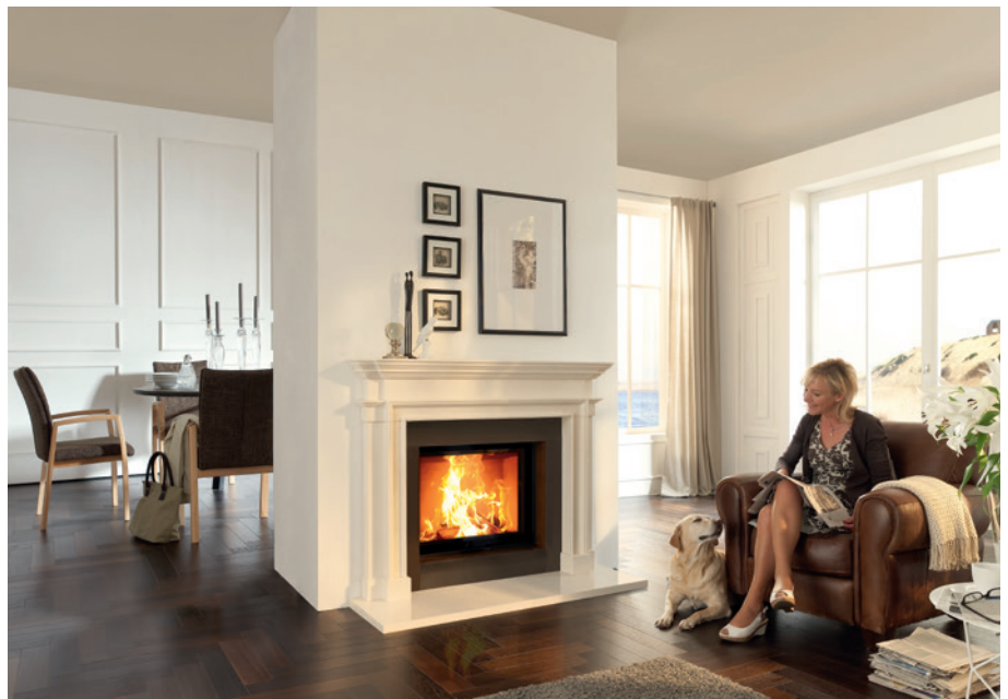
Camina N3 mit Lina 7357 h in Naturstein Blanco-Nacarado mit Habana sowie in der Wand verbauten Speicherblöcken.

Bei den Camina Speicherstein-Anlagen lassen sich zusätzlich zu dem ohnehin vielfältigen Anlagensortiment viele Sonderwünsche wie eine farblich individuelle Gestaltung der Verkleidung realisieren. Des Weiteren ermöglicht Camina einen Materialmix durch Designakzente mit Rostoptik. Diese besteht aus einer Keramikoberfläche, die nicht nur kratzfest und leichter als Stahl oder Aluminium ist, sondern sich auch durch ihre hohe Hitzebeständigkeit auszeichnet und für viele Camina-Modelle Verwendung finden kann. Auf Anfrage können weitere optische Veränderungen vorgenommen werden, wie zum Beispiel Bankablagen und Frontblenden aus Rohstahl in geölter oder lackierter Optik statt schwarz gepulvert. Eine leichte Demontage der Speichersteinanlagen sorgt außerdem dafür, dass der Traumkamin bei einem Umzug einfach mitgenommen werden