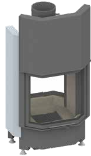
Pano TV 55 mit hochschiebbarer Frontseite und schwenkbarer Rückseite