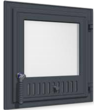
Grundofentür Groß, Türanschlag rechts