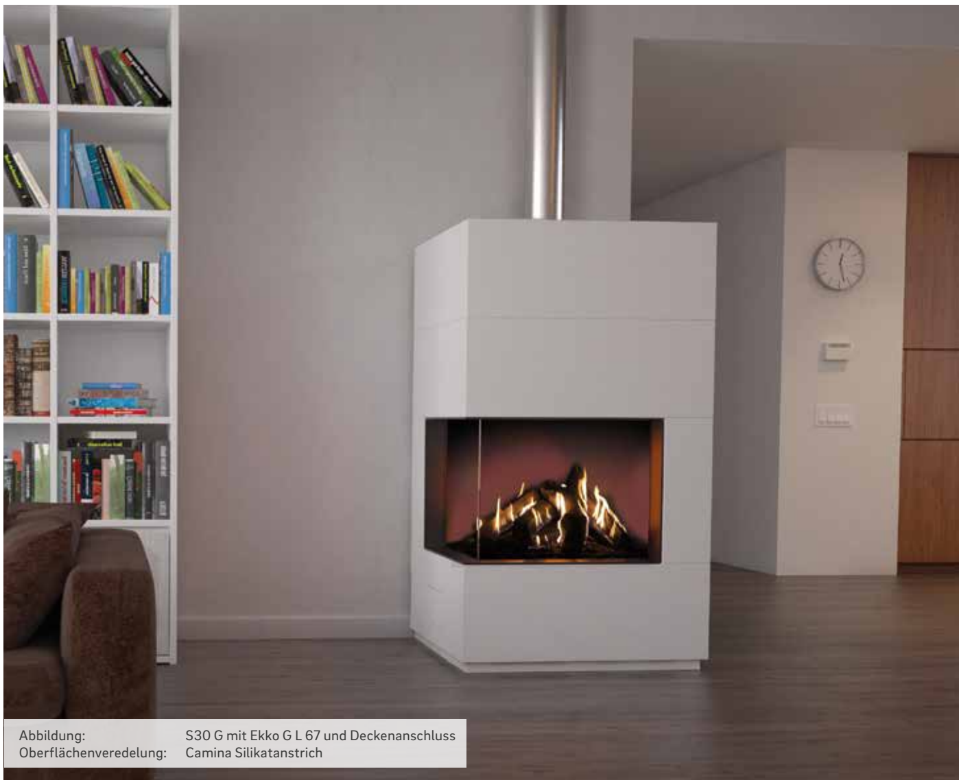
Abbildung: S30 G mit Ekko G L 67 und Deckenanschluss Oberflächenveredelung: Camina Silikatanstrich