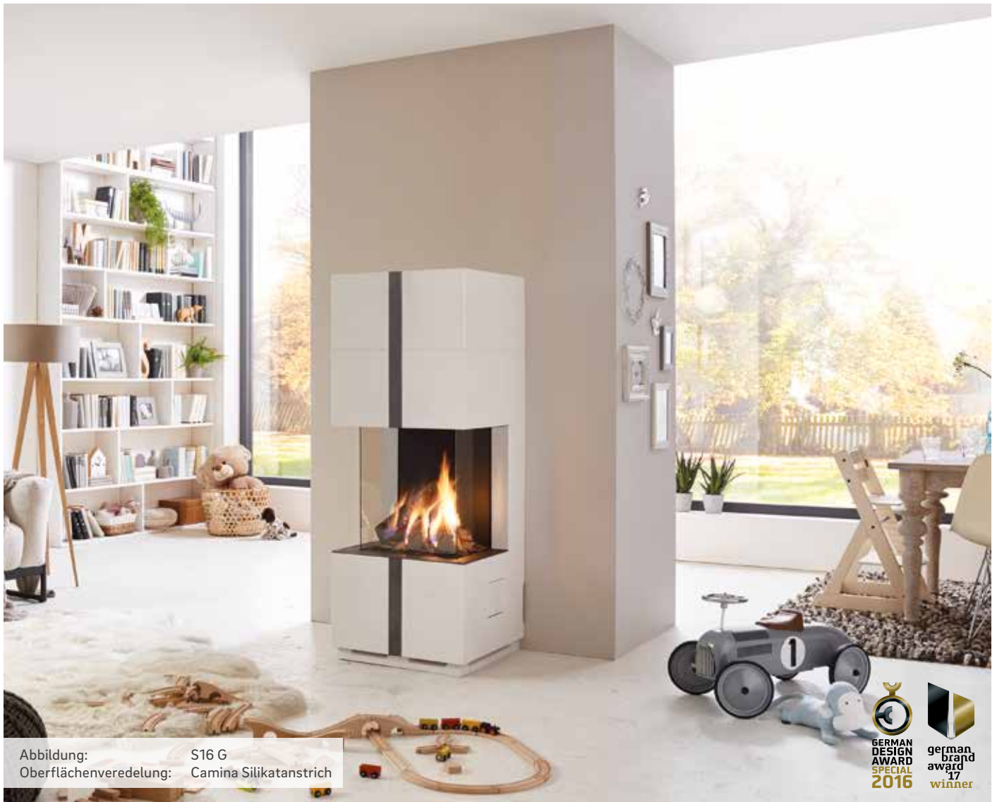
Abbildung: S16 G Oberflächenveredelung: Camina Silikatanstrich