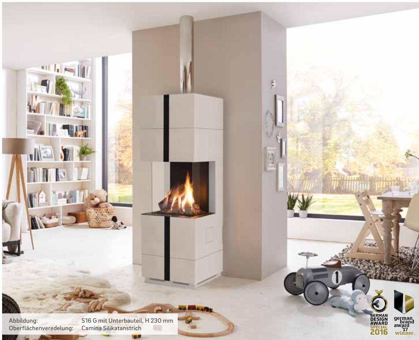
Abbildung: S16 G mit Unterbauteil, H 230 mm Oberflächenveredelung: Camina Silikatanstrich