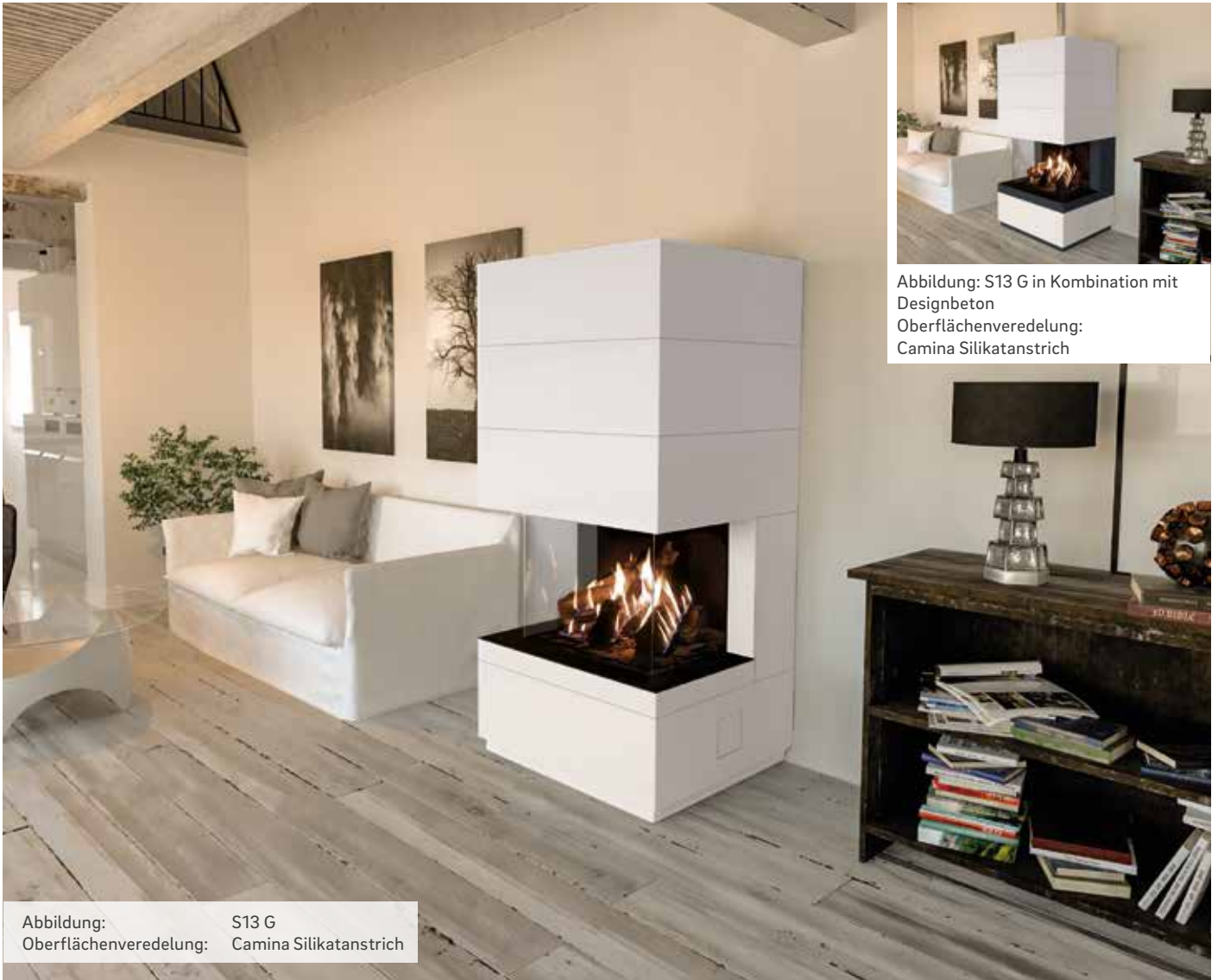
Abbildung: S13 G in Kombination mit Designbeton Oberflächenveredelung: Camina Silikatanstrich