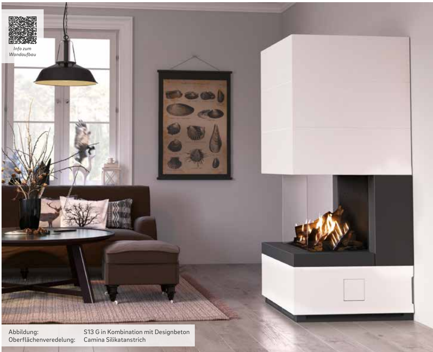
Abbildung: S13 G in Kombination mit Designbeton Oberflächenveredelung: Camina Silikatanstrich