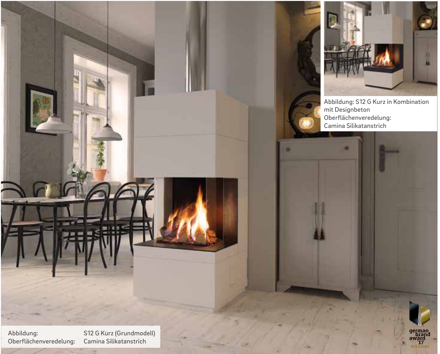
Abbildung: S12 G Kurz in Kombination mit Designbeton Oberflächenveredelung: Camina Silikatanstrich