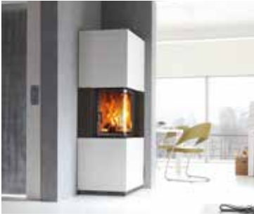
Abbildung: S3 in Kombination mit Designbeton Oberflächenveredelung: Camina Silikatanstrich